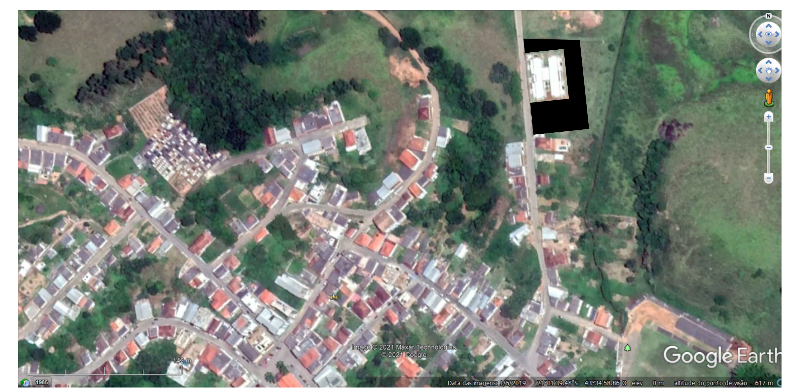
PLANTA DE LOCALIZAÇÃO DO ESTACIONEMTO SEM ESCALA