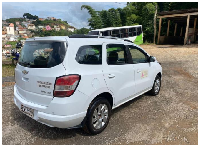
LOTE 04 – CHEVROLET SPIN 1.8 LTZ, 8V, 2014/2015, PLACA PUK 1318

Prefeitura Municipal de Senhora dos Remédios Rua Coronel Ferrão, 259 – Centro CEP: 36275-000 – Minas Gerais Telefax: (32) 3343-1145 CNPJ: 18.094.870/0001-32