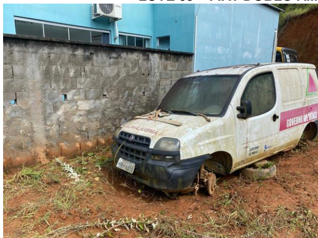
LOTE 09 – FIAT DOBLO AMB., 2009/2009, PLACA HMH 6816

Prefeitura Municipal de Senhora dos Remédios Rua Coronel Ferrão, 259 – Centro CEP: 36275-000 – Minas Gerais Telefax: (32) 3343-1145 CNPJ: 18.094.870/0001-32