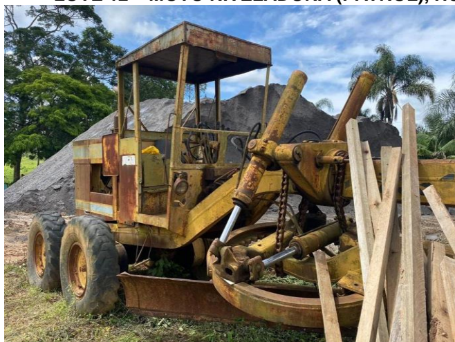
LOTE 12 – MOTO NIVELADORA (PATROL), HUBER WARCO 140C, 1985. MOTOR PERKINS

Prefeitura Municipal de Senhora dos Remédios Rua Coronel Ferrão, 259 – Centro CEP: 36275-000 – Minas Gerais Telefax: (32) 3343-1145 CNPJ: 18.094.870/0001-32